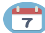
Calendario de días Inhábiles