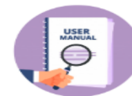
Manual de usuario